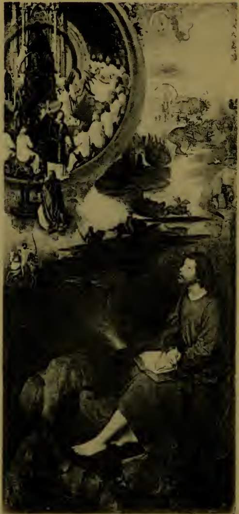
La Décollation de St-Jean Baptiste et St-Jean l'Evangeliste à Patmos, volets du triptyque : le Mariage Mystique de Ste-Catherine.